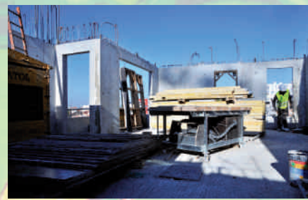
Les ouvriers attaquent le 4 ème étage de l'immeuble. Depuis les étages élevés, on aperçoit au loin une forêt de grues, symbolise du renouveau du quartier.